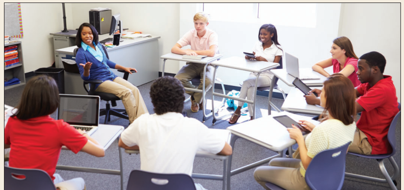
* Monkey Business Images/Shutterstock.com

* Adaptación de http://www.theinclusiveclass.com/2016/04/5-signs-that-classroom-is-inclusive.html